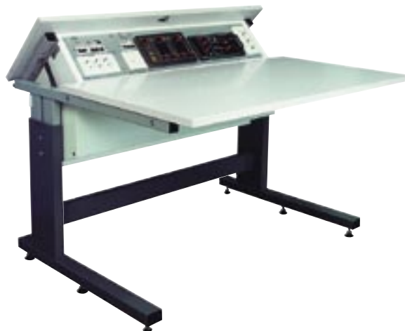
TM-MLA/YA, kallistuva mittalaitepöytä, lyhyt malli