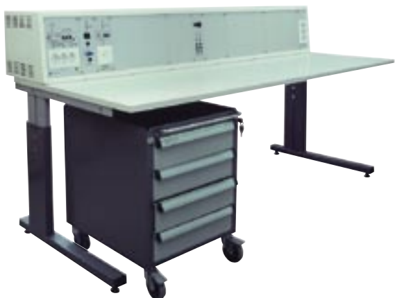
TM-MLP/M, matala mittalaitepöytä