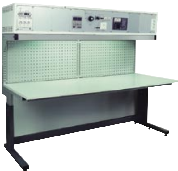
TM-MLP/K, korkea mittalaitepöytä