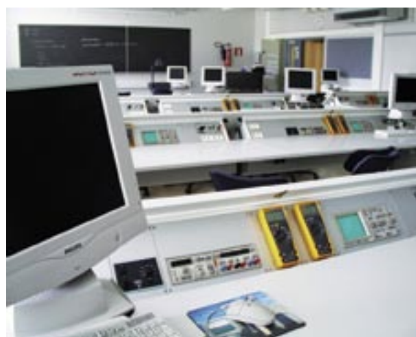
Laboratorioiden, tarkastamojen, sähkötyötilojen, fysiikan, elektroniikan ja sähkötekniikan opetusluokkien erilaiset sähkölähteet, testi- ja mittalaitteet koottuna yhteiseen työpöytään asennettavaan laitepaneeliin.