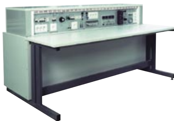
TM-MLP/MO, moottoroitu mittalaitepöytä